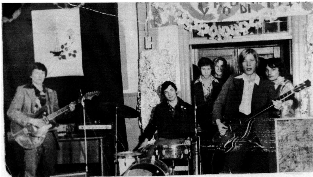
сально-инструментальный ансамбль «Юность»