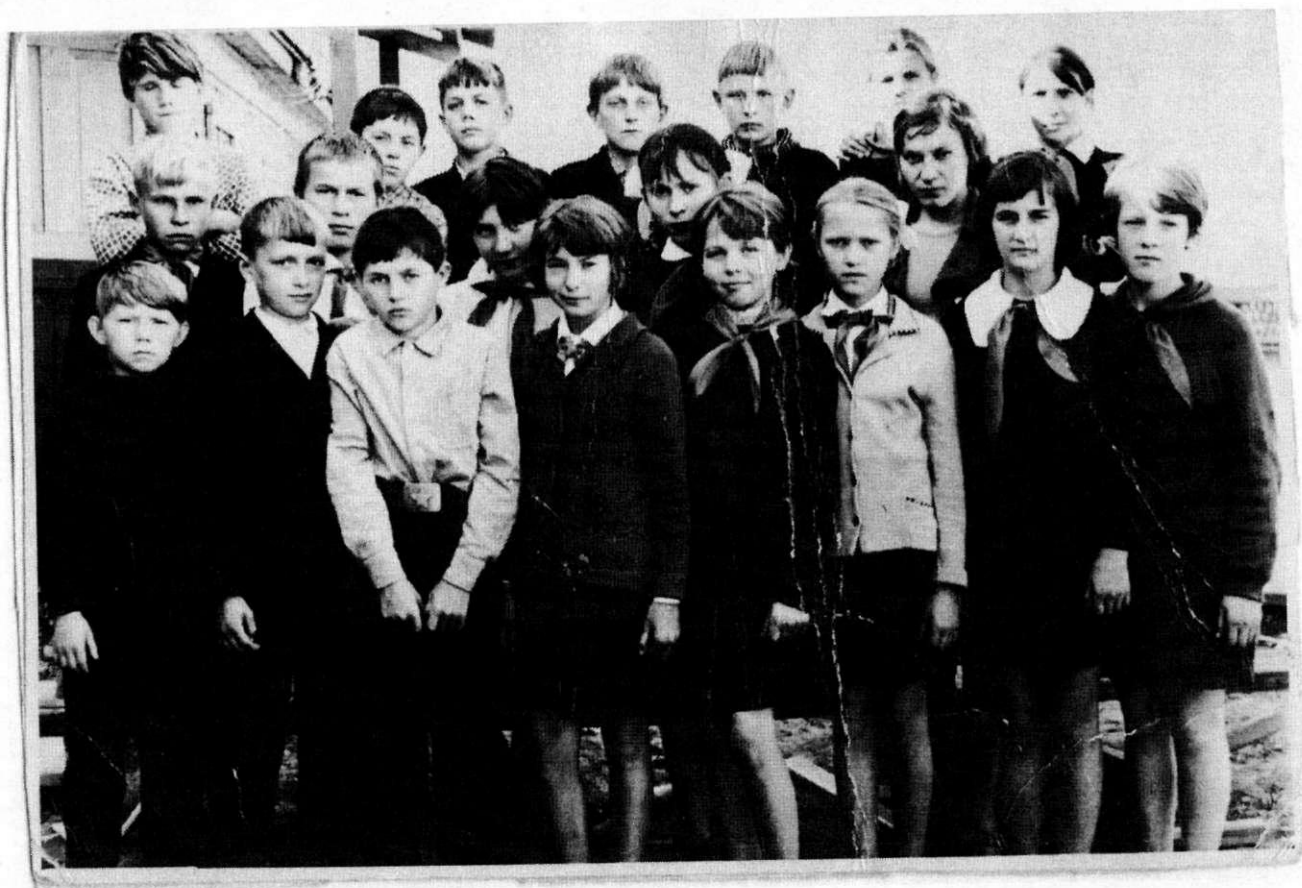
В 4 классе нас разделили и до 9 класса был класс «а» и класс «б».