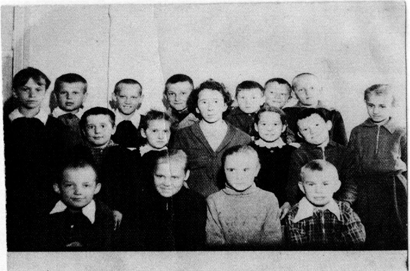
Третий класс (?)