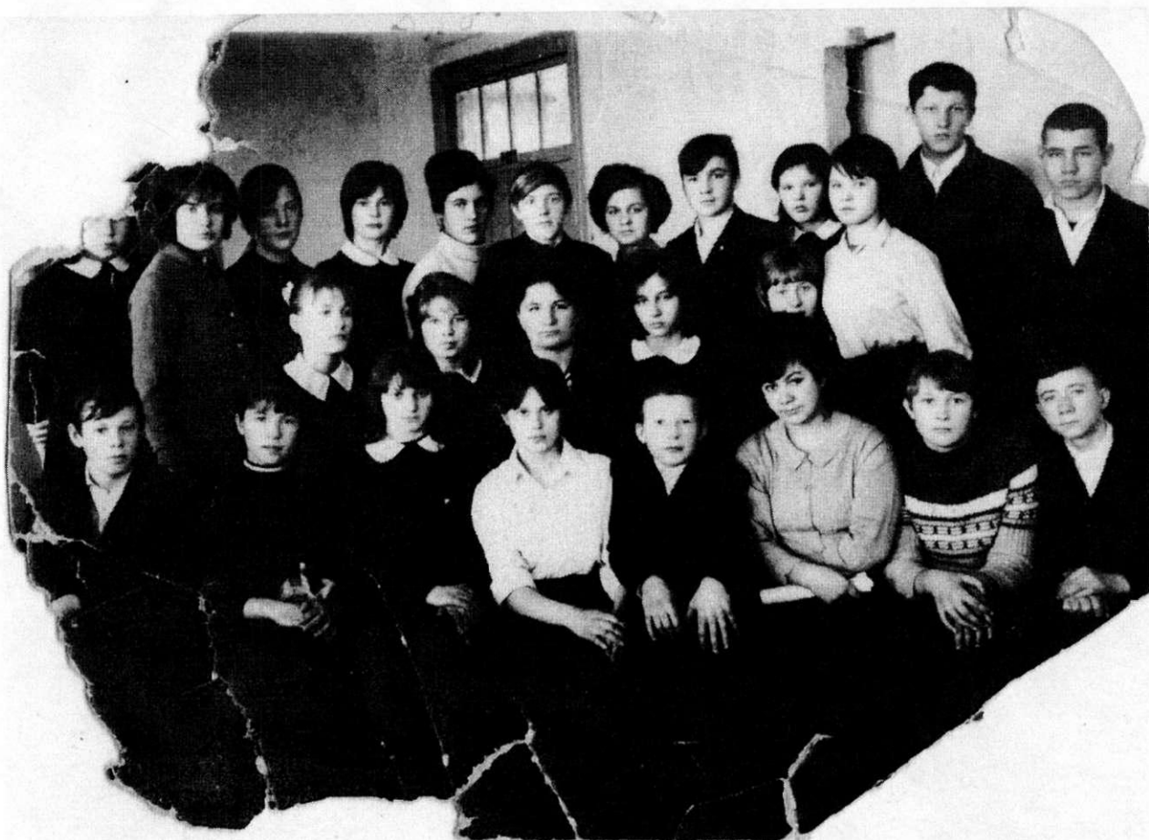
8 класс (1969г)