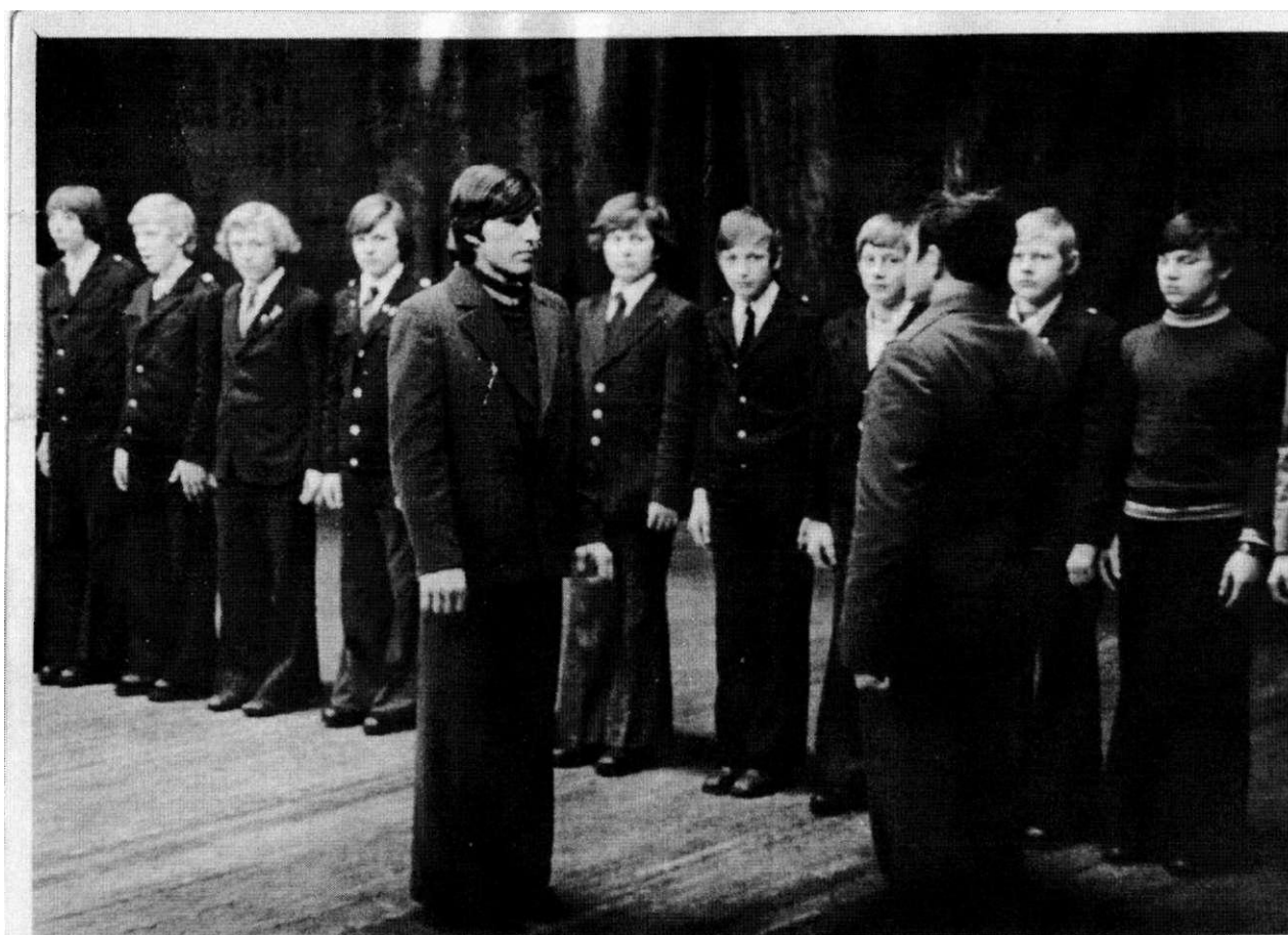
вокальный ансамбль и строя в местном клубе. Наши «Орлы»!