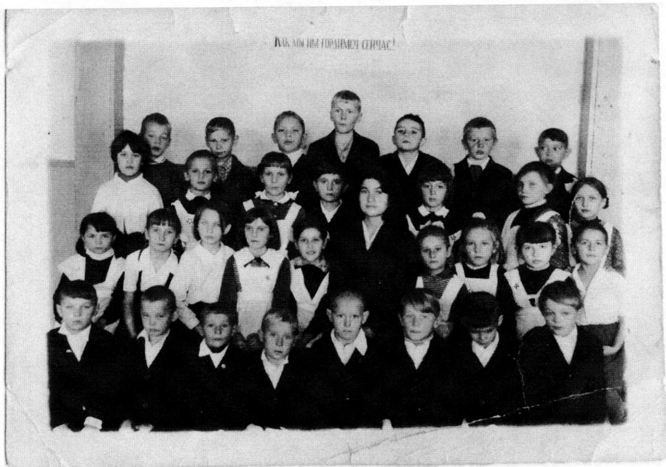
1972год – 2 класс; 1973год – 3 класс