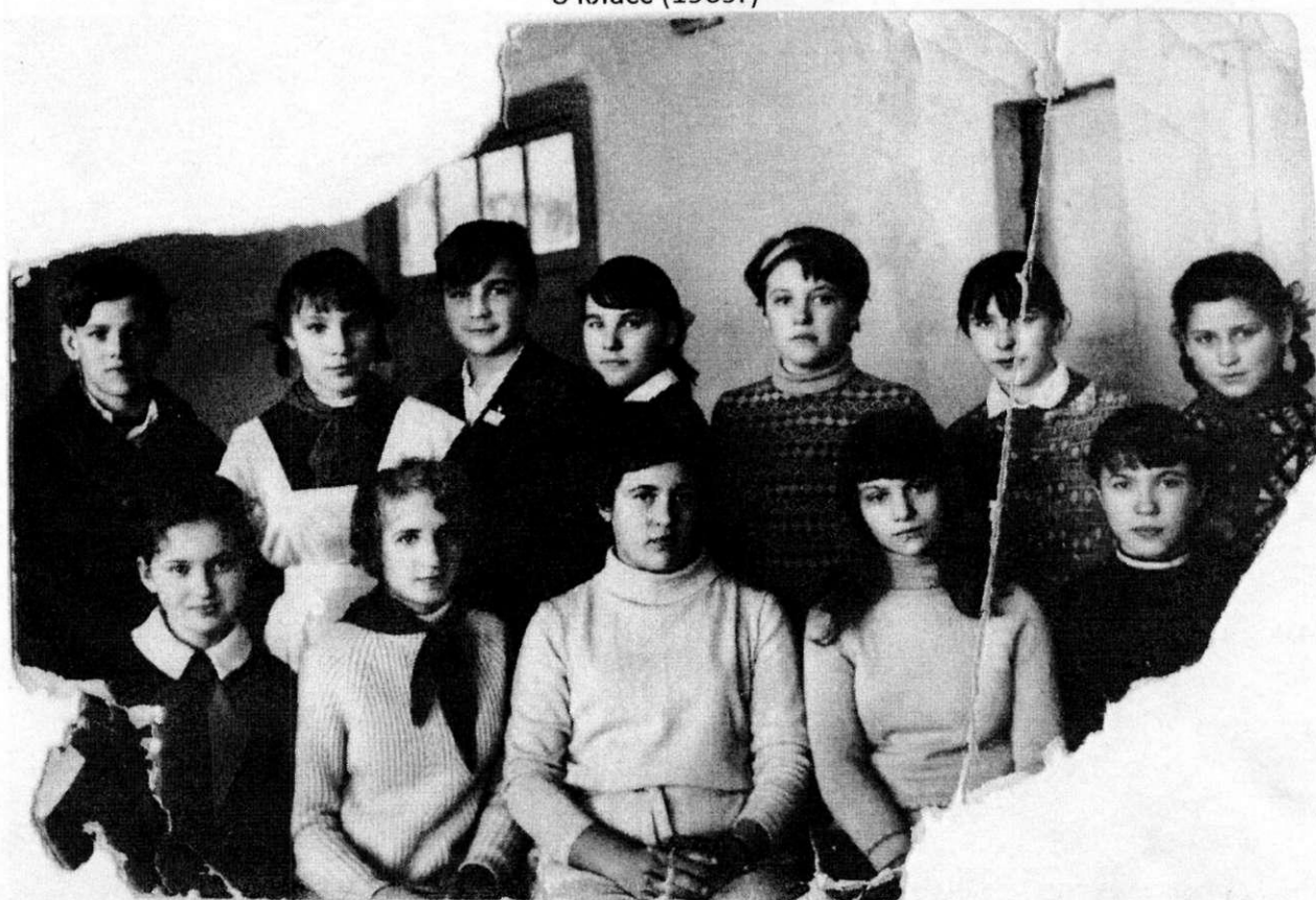
В основном ребята 4 выпуска. (1969-70г)