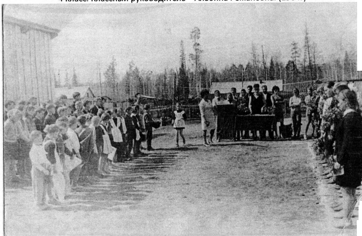
Последний звонок (1969г)